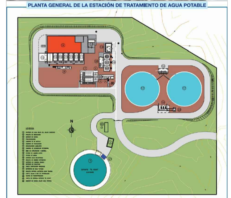
E.T.A.P. Campana de Oropesa