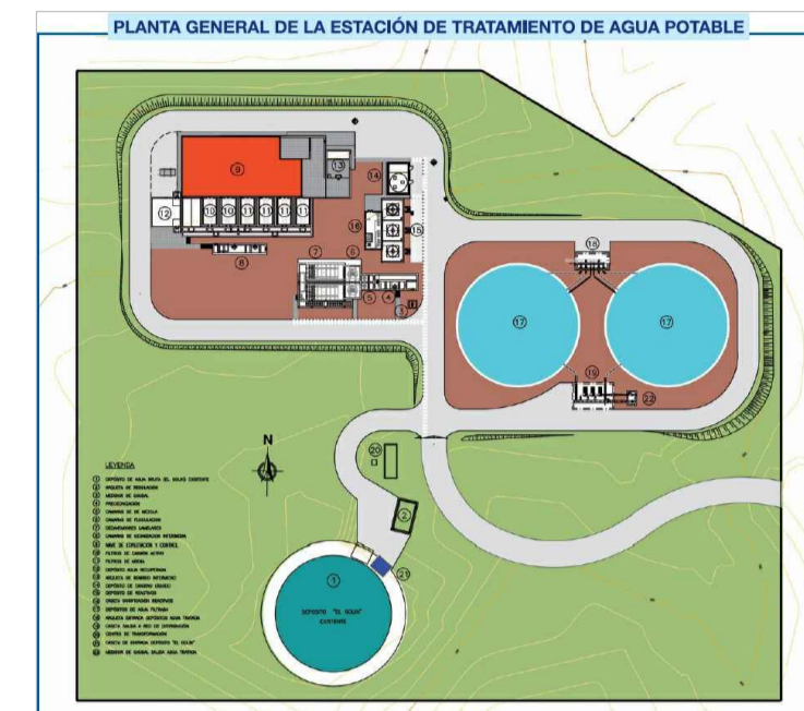
E.T.A.P. Campana de Oropesa